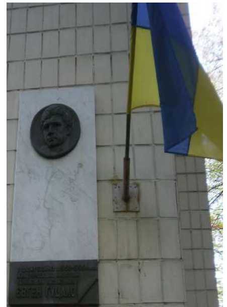
Меморіальна дошка у Києві на будинку N 3 по вулиці Михайла Омеляновича-Павленка , де жив і працював Євген Гуцало

Відтак, українські урядовці розпорядилися поховати видатного українського письменника, лауреата Державної премії України імені Т.Шевченка Гуцала Євгена Пилиповича на Байковому кладовищі і спорудити надгробок на його могилі та встановити меморіальну дошку на будинку № 3 по вулиці Суворова у місті Києві, де жив і працював Євген Гуцало.