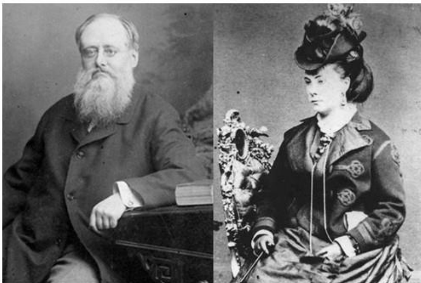
Вілкі Коллінз і Керолайн Грейвс

Коллінз не був одружений, але перебував у громадянському шлюбі з Кароліною Грейвз, яка послужила йому прототипом головної героїні “Жінки в білому”, і мав трьох позашлюбних дітей (дочки Маріан (1869) і Гаррієт Констанція (1871), син Вільям Чарльз (1874)) від другої жінки, Марти Рад, яку утримував, але ніколи не вважав за потрібне пов’язати себе будь-якими зобов’язаннями.