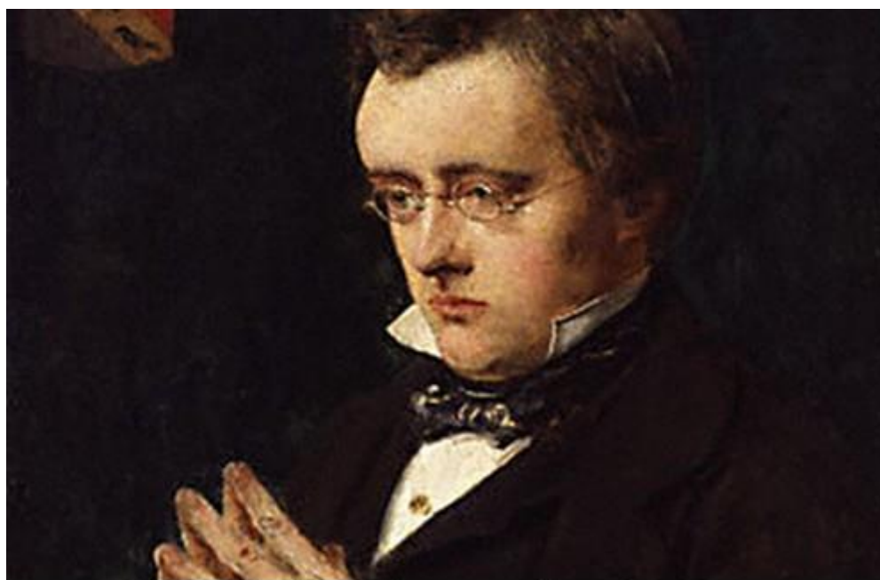
Вілкі Коллінз в молодості

творчого спрямування, метою якого була боротьба проти умовностей вікторіанської епохи.