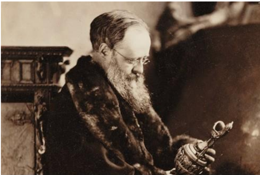
Письменник Вілкі Коллінз

Одночасно з роботою на підприємстві Вілкі створив перший твір - оповідання «Останній тренер», який в 1843 році був опублікований в журналі «Illuminated». У тому ж році англієць написав дебютний роман «Іолані, або Таїті, як це було», запропонував його друкованого дому «Charman & Hall», але в 1845 році отримав відмову. Книга так і не вийшла в світ за життя автора: перше видання з'явилося лише в 1999-му.