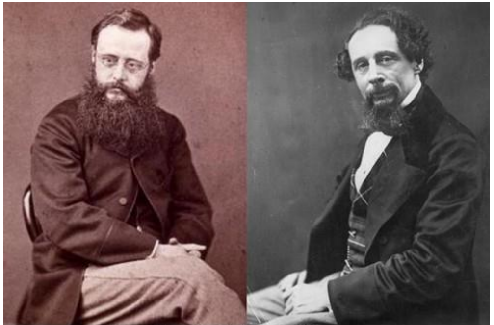
Вілкі Коллінз і Чарльз Діккенс

г р а ф с т в у Корнуолл в липні-серпні 1 8 5 0 року. Компанію письменнику становив художник - пейзажист Генрі Брандлінг.