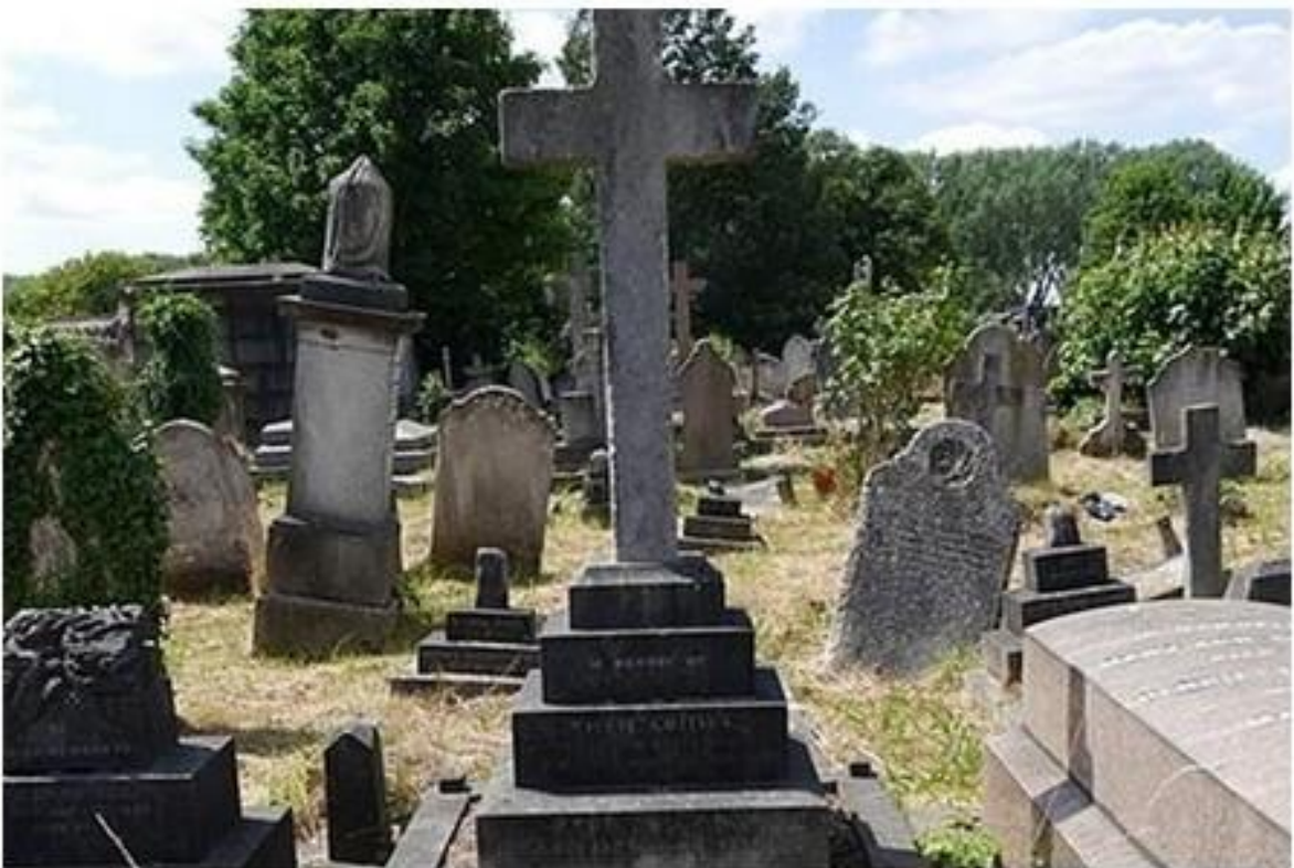
Могила Вілки Коллінза

Вілкі Коллінз помер 23 вересня 1889 року від паралітичного удару. Тіло поховано на Кенсальском зеленому кладовищі в Західному Лондоні.