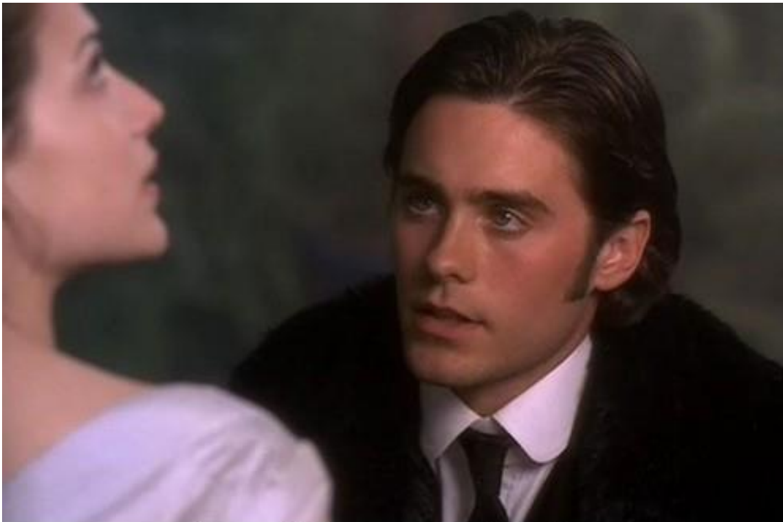
Джаред Лето в екранізації книги Вілкі Коллінза «Безіл»

В екранізації 1998 року, знятої індійським режисером Радгою Бхарадвадж, головну роль виконав Джаред Лето , його обраницею стала Клер Форлані , а друга, який познайомив Безіла з незнатної дівчиною, зіграв Крістіан Слейтер .