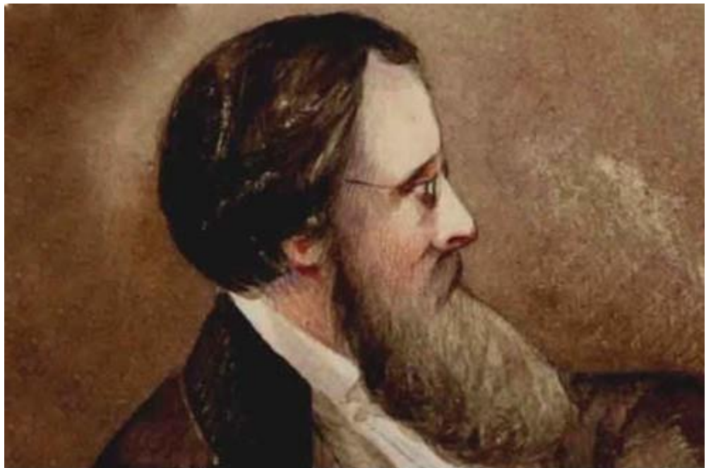
Портрет Вілки Коллінза

році Вілкі опублікував першу серйозну роботу - «Спогади про життя Вільяма Коллінза, есквайра, члена Королівської