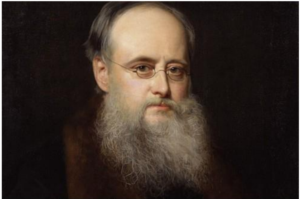
Портрет Вілкі Коллінза

Коллінз – письменник, чия творчість незаслужено виявилася поховано під шедеврами Марка Твена і Чарльза Діккенса . Його твори відрізняються самобутністю, містичними захоплюючими сюжетами, гостротою мови і легкістю сприйняття, а роман «Жінка в білому» ( «The Woman in